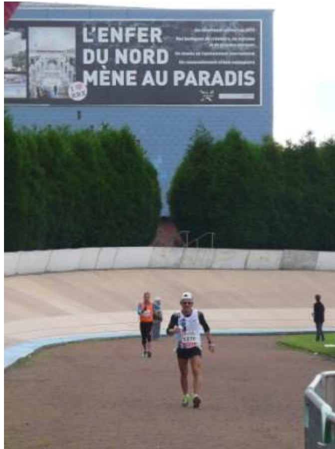
Le circuit 2015 empruntait la piste du mythique vélodrome de Roubaix