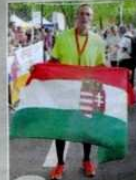
Le Hongrois Zoltan Czukor, vainqueur comme en 2011.